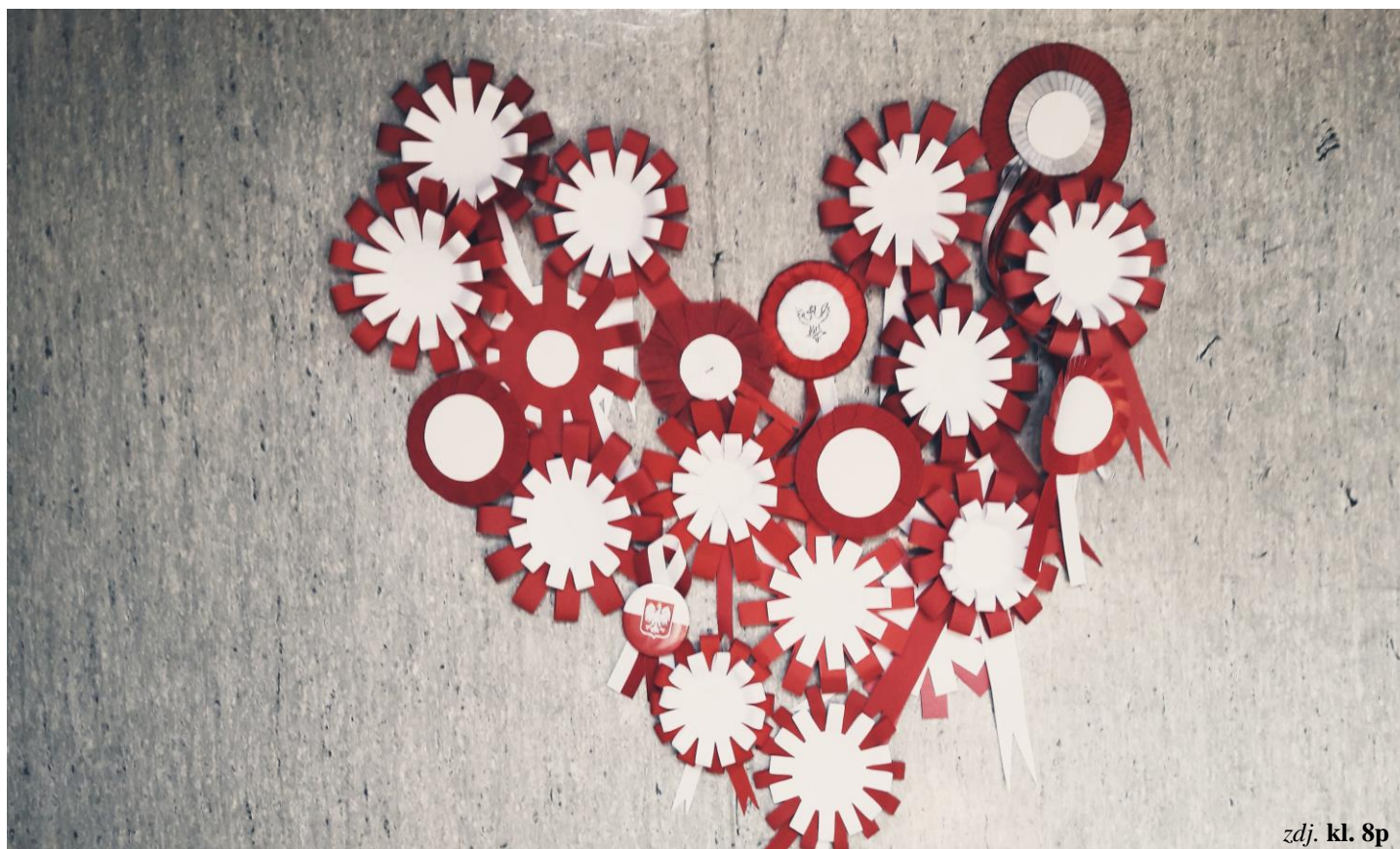
zdj. kl. 8p