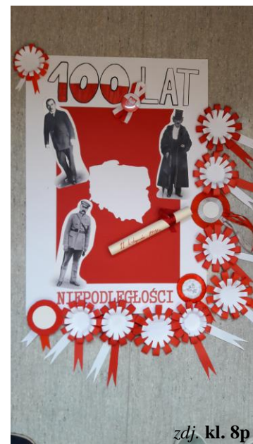
zdj. kl. 8p