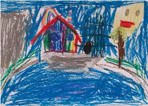
Jeremi ; kl. 1a, SP nr 6

...w której mogłabym obserwować hodowane tam zwierzęta. Martyna ; kl. 2 a, SP nr 6