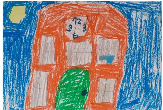
Antek ; kl. 1a, SP nr 6

...z zajęciami chemicznymi. Zosia ; kl. 2 a, SP nr 6