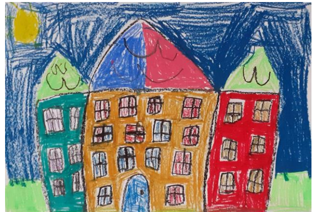
Julia ; kl. 1a, SP nr 6

...z salą do projektowania ubrań. Eliza ; kl. 2 a, SP nr 6