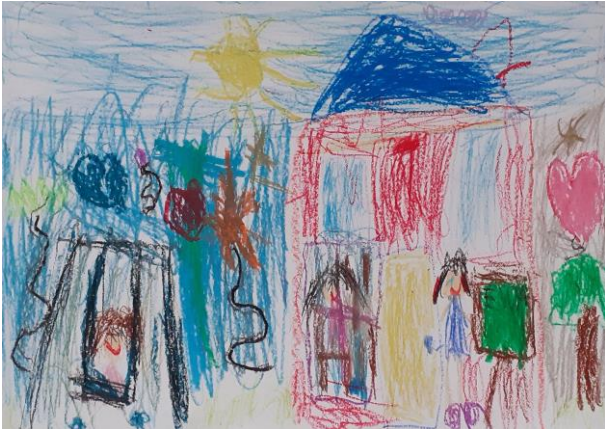
Ola ; kl. 1a, SP nr 6

...z miejscem do muzykowania, z dużą ilością instrumentów muzycznych. Kasia ; kl. 2 a, SP nr 6